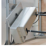
※アルミフレームはトイレットペーパーに合せてモーター（自動回線の邪魔をしないように）に設置します。