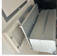
※別途アンカー工事が必要。