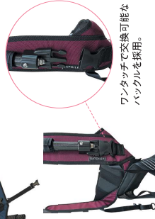
ワンタッチで交換可能なバックルを採用。