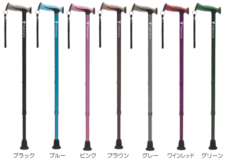
ブラック ブルー ピンク ブラウン グレー ワインレッド グリーン