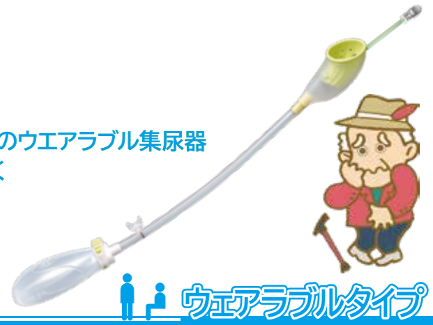
ウェアラブルタイプ AS-URI S/M/L

トイレが心配な方のためのウェアラブル集尿器 装着しても目だたにくく 安心して外出できます