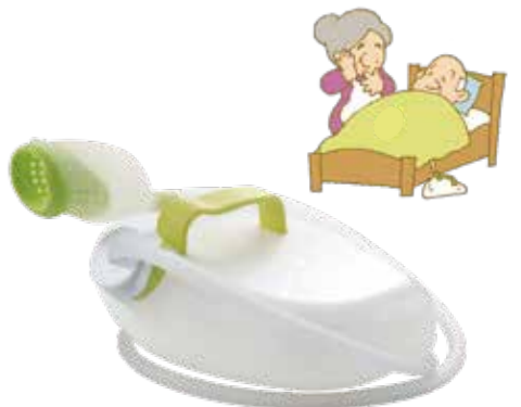
ウェアラブルタイプ 就寝用 AS-DUR010