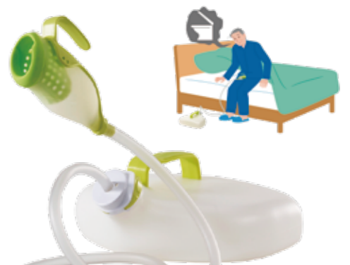
手持ち型採尿器 就寝用 AS-TUR010