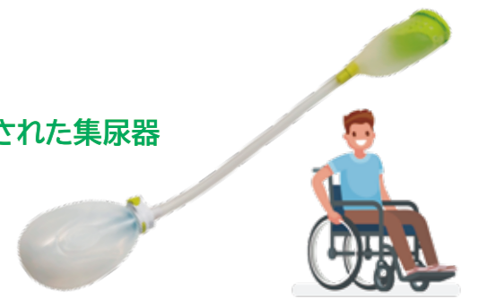
ウェアラブルタイプ 車いす用 AS-KUR010

車いすユーザーのために開発された集尿器 トイレの不安や負担を軽減し 安心して外出できます