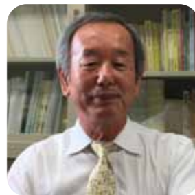
大阪教育大学 金森裕治 教授

障害者差別解消法が 2016 年 4 月に施行され、公立学校での合理的配慮の提供は、法的義務になりました。児童生徒の実態に応じた合理的配慮に基づく教材の提供が必要となります。