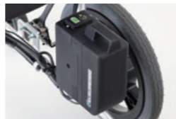
バッテリーユニット部/ 電源スイッチ