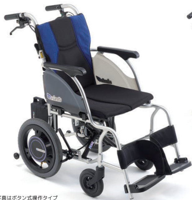
※写真はボタン式操作タイプ

重量は従来の電動車いすの半分 約 15kg! POWERCHAIR どなたでも簡単に操作ができる軽量電動アシスト車いす。 負担になっていた散歩やショッピングが気軽にできます。