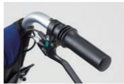
グリッププッシュ式 操作部