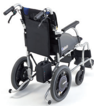
※折りたためて収納や持ち運び 車への積み込みにも適しています。