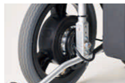
モーターユニット部