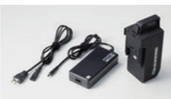
充電器、バッテリー