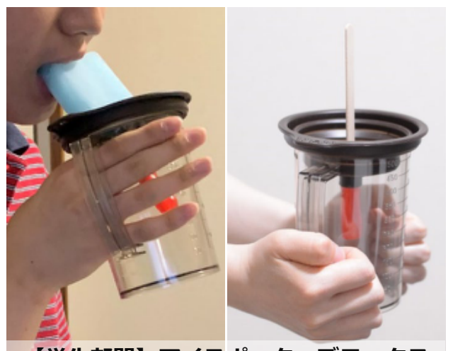
【学生部門】アイスポッターデラックス