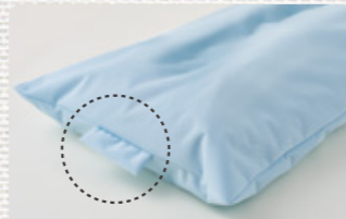
※カバーは防水タイプのみハンドル付き

*介護保険における福祉用具の貸与に関しては、居宅介護支援事業者等までお問い合わせください。*商品の取扱いにあたっては付属の取扱説明書をよく読んでご使用ください。*記載の価格は全て、メーカー希望小売価格です。*商品の仕様・価格は予告なしに変更する場合がありますのでご了承ください。*印刷の関係で実物とは色が異なることがあります。*本カタログの掲載内容及び写真イラストの無断転載は固くお断りします。