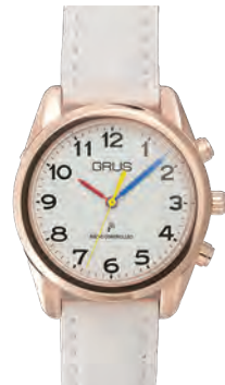
ローズゴールドケース