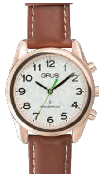
ローズゴールドケース