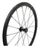
スピナジーX (24,25,26 インチ)