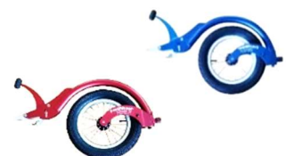
ブラック / ブルー / レッド