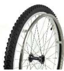
マウンテンバイク (24 インチ)