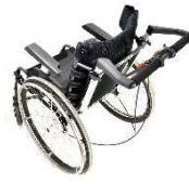
介助ブレーキ付き (22,24 インチ)