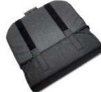
奥行調節式 (座幅 24~33 cm)