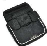
座面下用小物入れです。 座面シート取付けタイプ またはクッション取付けタイプ