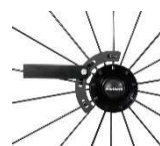
スピナジー-X 車輪用