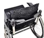
S3 高さ調節式押し手 (標準 / +10 cm)