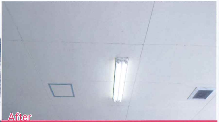
Case 3 食品工場 -2