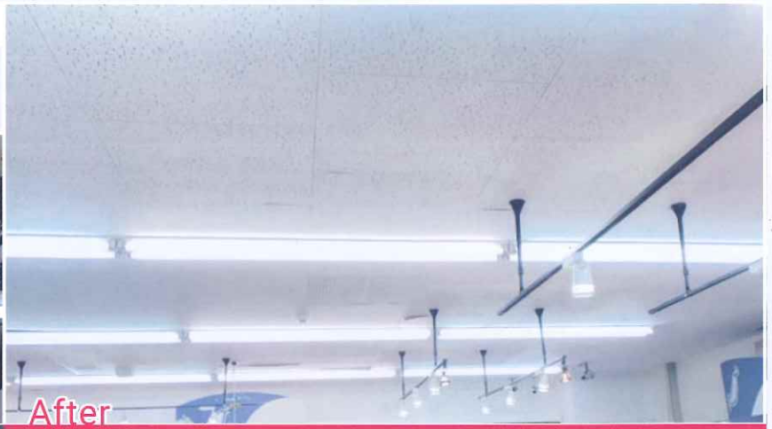
Case 2 食品工場