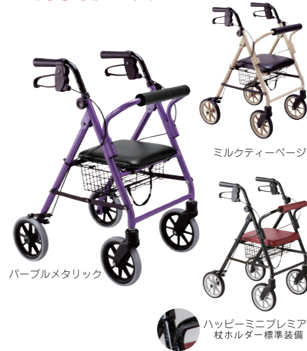
パープルメタリック