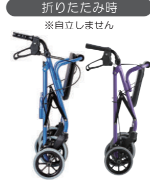
例)ハッピーII NB 例)ハッピーミニ