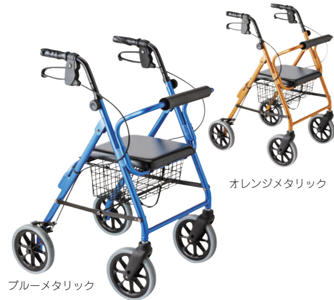
ブルーメタリック