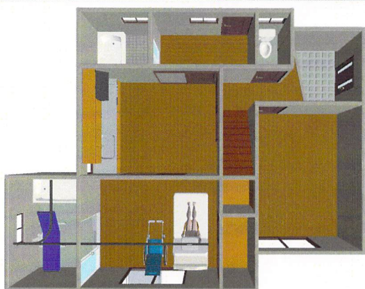
平面図から三次元画像まで