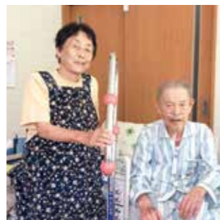
Smile voice Wさんご夫婦

ラ・クリップを使うようになって、起きたり、立ったりが全く苦にならなくなり、体も楽になりました。今ではこれがないと困ります。トイレも体の調子に合わせて歩いて行けますが、ラ・クリップがなかったら、今頃は起き上がれなくなっていたと思います。頼りにしています。