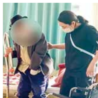
Smile voice デイサービス 理学療法士

パイプを掴む位置を移動させることができるため、立ち上がり後の重心移動が楽に行え、安心して方向転換ができるようになったと喜んでいただいております。