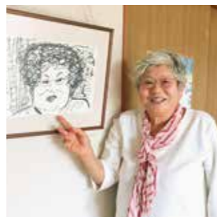
Smile voice Iさんの奥様

できるようになったことで脚力がつき、階段も上がり降りできます。病気が進行しないように、自分でできることを毎日繰り返し行い、現状を維持した普通の生活ができるのは、ラ・クリップがあるから。自分でできるということは最高なんです。