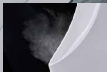
飛散するエアロゾルは、ウイルス感染につながる可能性もあります。

不特定多数の人が利用するトイレでは、ウイルス等の二次感染を引き起こさないよう衛生管理の徹底が必要となります。トイレの清潔を保つサニタイザーは、こうした観点からも必要不可欠な設備となっています。