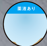
薬液あり 尿石形成・付着が ほとんど見られない