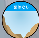
薬液なし 尿石形成・付着が 進行

洗浄水とともに適量の薬液がゆっくりと便器表面を除菌・洗浄していきます。その効果は水が溜まるトラップ内、さらに排水管まで波及。清潔さを守るだけでなく、便器内を細菌やバクテリアが繁殖しにくい弱アルカリ性の状態に維持し、嫌な悪臭や、詰まりの元となる尿石の発生を防ぎます。