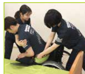
<介助者2名> 座奥へしっかり座れます。