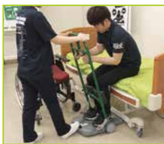
スタンディングハンドルをつかみます。