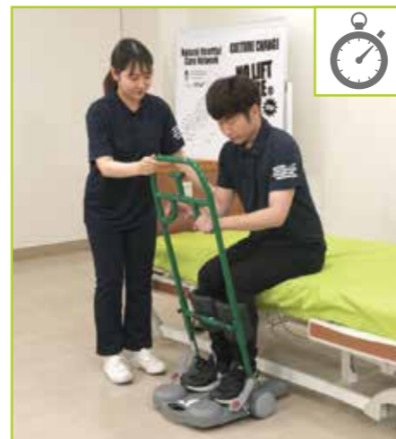
立ち上がりトレーニングとして時間を測り、被介助者の動作状態の確認を行います。

手術後の立ち上がりや、ベッドサイドリハビリテーションのプログラムが実施できます。