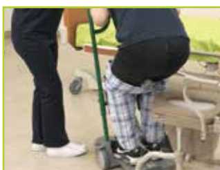
その場で方向転換ができます。