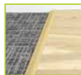
カーペットの断端例