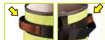
ストラップハンドル