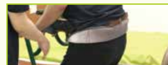
介助時の折り返し