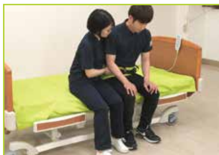
■ 立ち上がりの補助