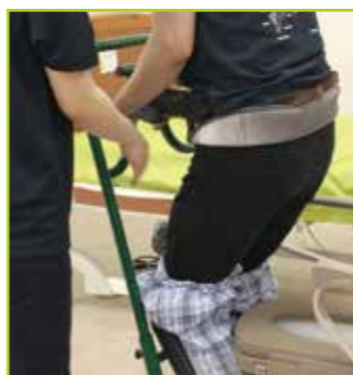
テイクオフベルトの下部をまくり上げます。