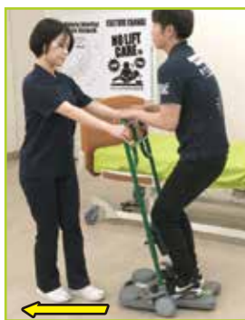
介助者は自分の方向にテイクオフを引きずります。