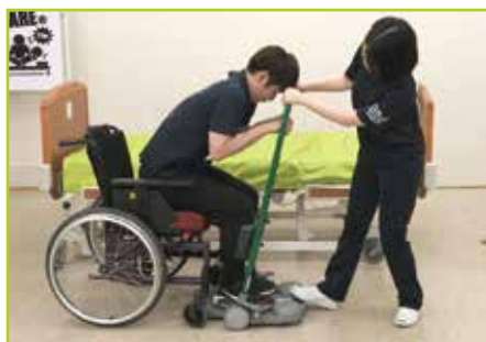
■ 座奥への座り直し