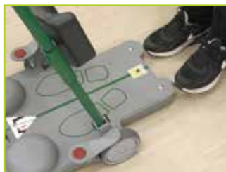
足型イラストに足を乗せます。