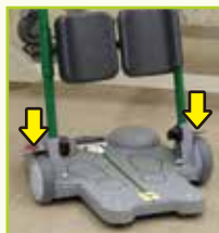
ブレーキプレート