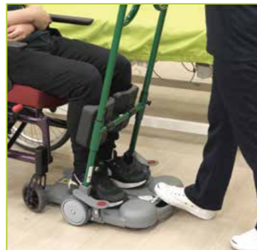
車いすのフットレストを外します。被介助者は両足をベースに乗せます。