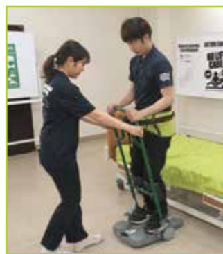
介助者は前方より補助します。