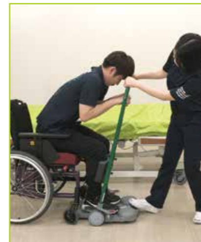
被介助者は半座位姿勢を取ります。介助者はベースを足で押さえます。