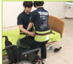
お互いがストラップをつかめるので、姿勢が安定します。