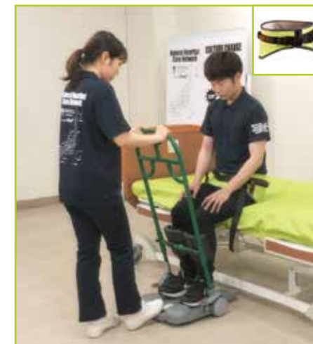
重度被介助者にはテイクオフベルトを併用します。