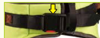
バックル付きベルトストラップ