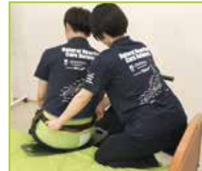
被介助者の背面からサポートします。