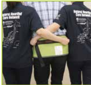
<介助者2名> 介助者の腕を交差させて、安定感を増したサポートができます。