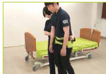
■ リハビリテーション