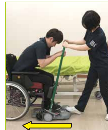
介助者は座奥に向かってテイクオフを押しします。