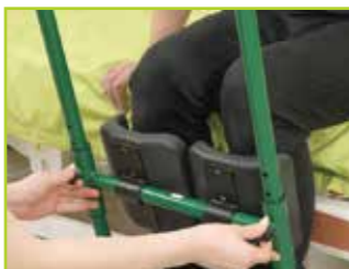
レッグサポートを調整します。