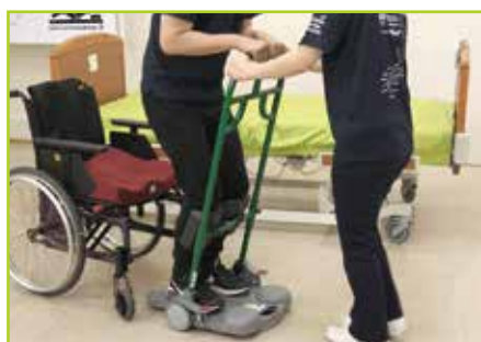
■ 室内の短距離移動