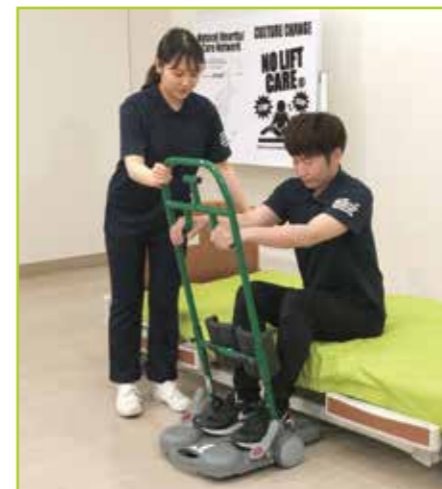
ベッドの高さ調整により、負荷を変えてトレーニングできます。