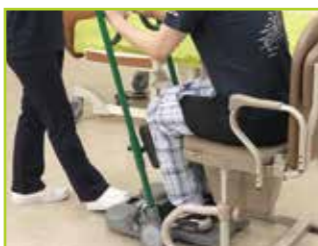
被介助者の正面でスタンディングハンドルをつかめます。