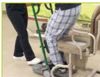
狭い空間でもアプローチしやすいです。

コンパクト設計のベースにより、狭い空間でも取り回しができます。同じ基点でベースが回転できるので、トイレ介助がしやすいです。