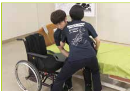
重度被介助者の場合〔移乗例1〕 介助者が被介助者を支えながら移乗します。