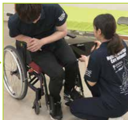
被介助者の両足大腿の下にフローボードオーバルXSサイズ1枚をそれぞれ差し込みます。