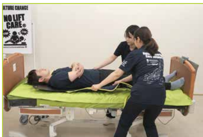
■ 仰臥位姿勢でスリングシート装着の補助