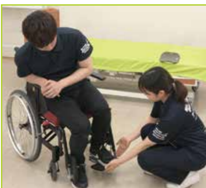
被介助者の足を車いすのフットレスト等に乗せ、大腿部を座面から浮かせます。