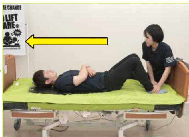
被介助者自身が両膝を曲げて足底を踏ん張り、ベッド上方へ伸びあがるようにして上方へ移動します