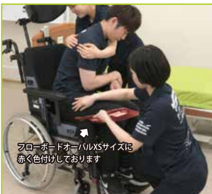
フローボードオーバルXSサイズは赤く色付けしております