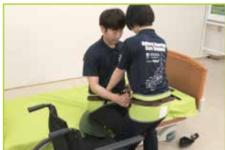
重度被介助者の場合〔移乗例3〕 テイクオフベルト(別売)を併用して体幹を支えやすくして移乗します。