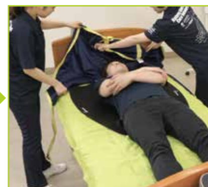
スリングシートの足側から被介助者の尾骨の位置まで引き込みます。