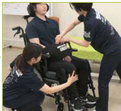
フローボードオーバルXSサイズを外側より引き抜きます。