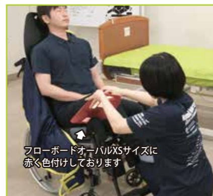
フローボードオーバルXSサイズは赤く色付けしております