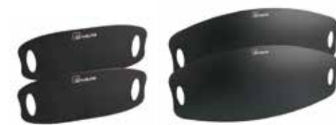
フローボードオーバルXSサイズ