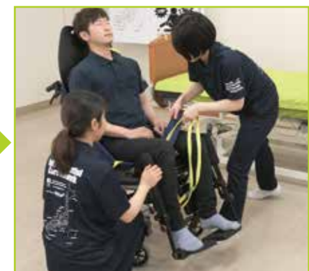
スリングシートの脚部を引き上げます。