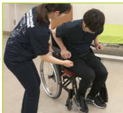
被介助者は前傾姿勢を取り、車いすのアームサポートをつかみながら車いすの座面の奥に向けて臀部をスライドします。