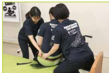
重度被介助者の場合〔移乗例5〕 テイクオフベルト(別売)を併用して被介助者2名で介助して移乗します。