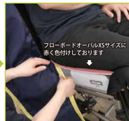
フローボードオーバルXSサイズに赤く色付けしております