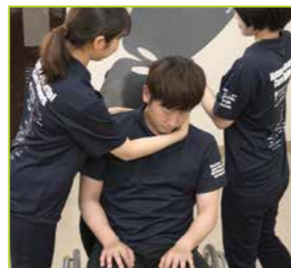
フローボードオーバルMサイズ2枚を被介助者の背中と車いすの背もたれの間差し込みます。