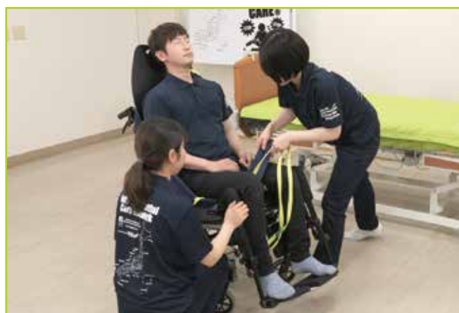
■ 座位姿勢でスリングシート装着の補助