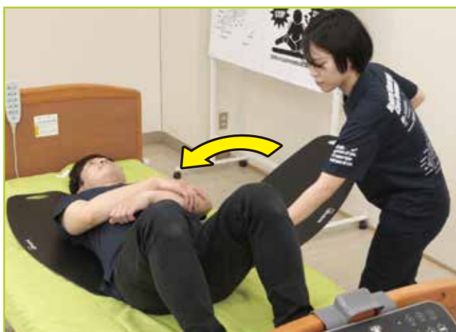
被介助者の左右両側から1枚ずつ体幹に対して平行に差し込みます。