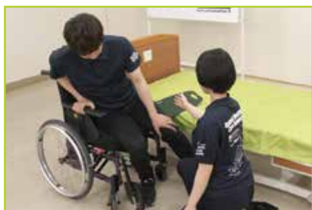
軽度被介助者の場合 ご自身でフローボード上を移乗します。