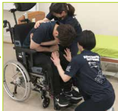
被介助者の膝を押し、車いすの座面の奥に向けてポジショニングを行います。