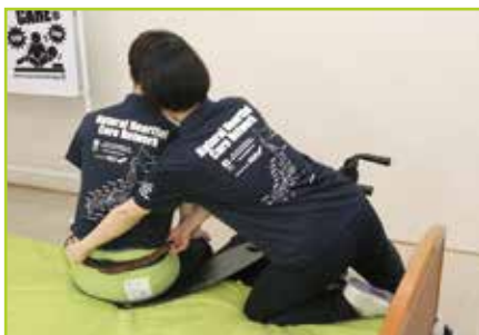
重度被介助者の場合〔移乗例4〕 テイクオフベルト(別売)を併用して被介助者の背面より介助して移乗します。