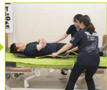
スリングシートの中心が被介助者の体幹中央から外れないように注意します。