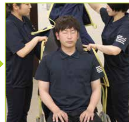
スリングシートの足側からフローボードオーバルMサイズ2枚の間を通し、中心が被介助者の背中と合うよう調整します。