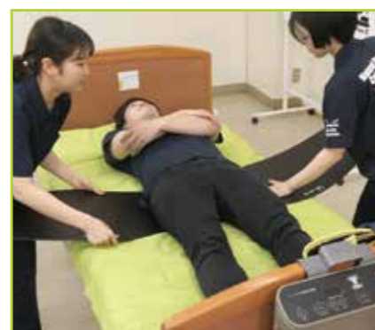
フローボードオーバルMサイズ2枚を被介助者の左右両側から1枚ずつ体幹に対して平行に差し込みます。