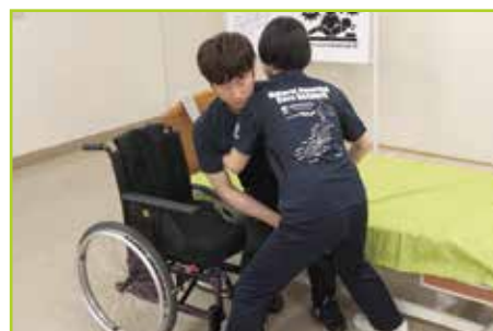
重度被介助者の場合〔移乗例2〕 動きに合わせて介助者の体の向きを変えながら2〜3回に分けて移乗します。