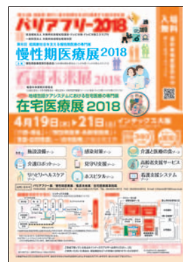
展示会案内リーフレット