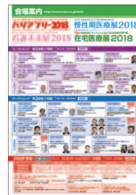
会場案内リーフレット