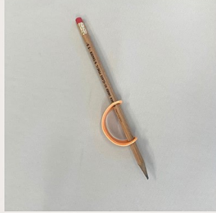
■保持性／持ち手改善