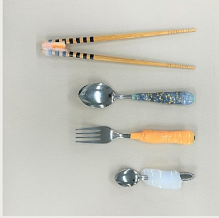
■補強／保持性／すべり止め等 使用したもの：マスキングテープ、クッキングシート、他