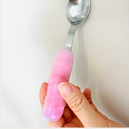
■グリップ性向上 使用したもの：食器洗い用スポンジ