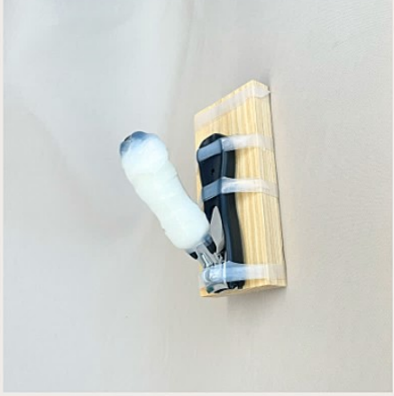
■すべり止め 使用したもの：かまぼこの板