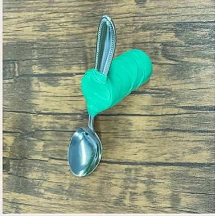
■結束 使用したもの：ペットボトルのキャップ