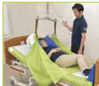
介護用リフトと併用