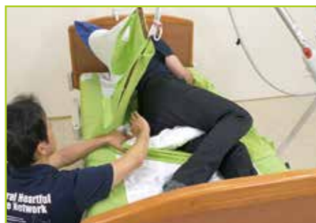
創傷部のケアをします。