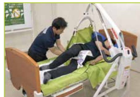
新しいおむつを仮当てして仰臥位に戻します。