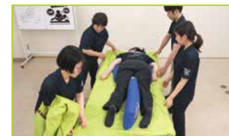
上側のセカンドシートを取り除き、ピローと体の位置を確認します。