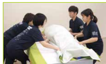
マットレスカバーの上を滑らせてマットレスの端に寄せます。