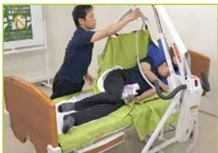
リフトで側臥位にします。