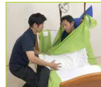
介護用リフトと併用