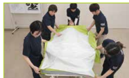
白い滑る面を上向きにしたセカンドシートを被介助者の上に被せます。