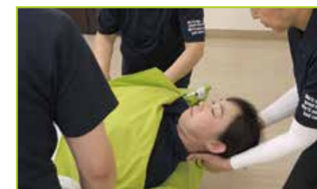
頭部がマットレス上端を超える位置まで被介助者を上方に滑らせながら移動させます。