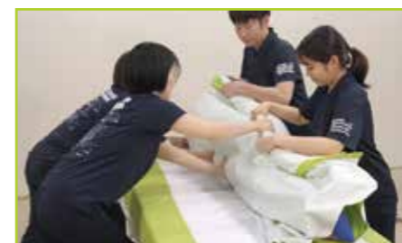
セカンドシートがほどけないよう、しっかりとついで回転させます。