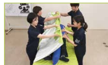
白い滑る面を上向きにしたセカンドシートを被介助者の上に被せます。