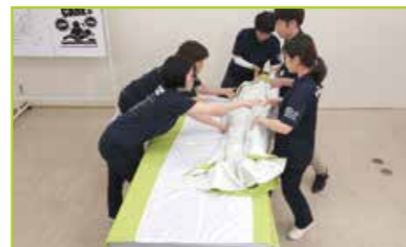
マットレスカバーの上を滑らせて、セカンドシートがほどけないようしっかりとついで回転させます。