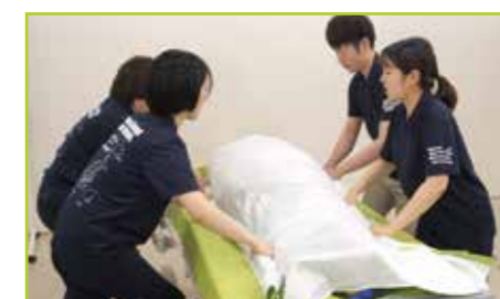
2枚のセカンドシートをまとめてつかみます。