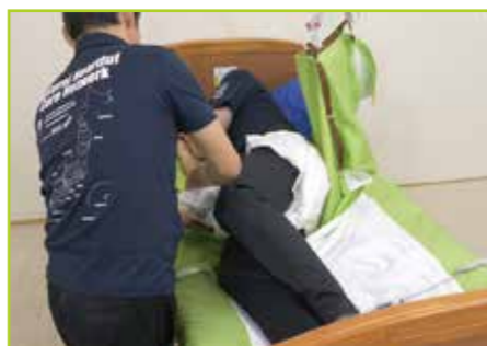
リフトで側臥位にします。