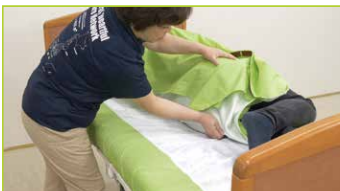
マニュアルハンドリング

マニュアルハンドリングでも、介護用リフトを併用しても、セカンドシートの大きな面で被介助者を包み、やさしくケアができます。