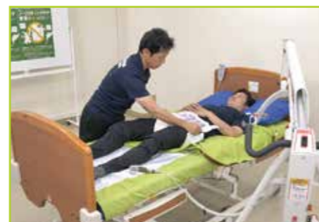
新しいおむつのテープ固定をして整えます。