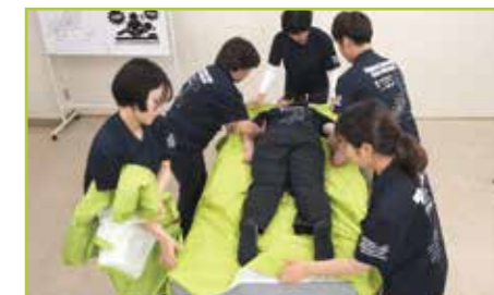
頭部がマットレス上に戻る位置まで被介助者を下方に滑らせながら移動させて、セカンドシートを取り除きます。