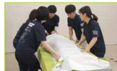
2枚のセカンドシートをまとめてつかみます。