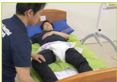
交換するおむつのテープを剥がします。