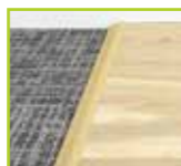
カーペットの断端例