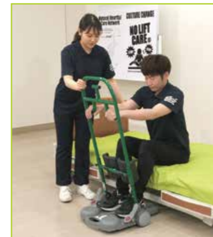
ベッドの高さ調整により、負荷を変えてトレーニングできます。