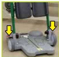
ブレーキプレート