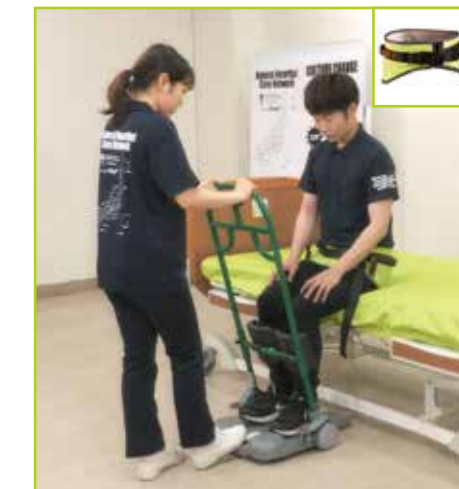
重度被介助者にはテイクオフベルトを併用します。