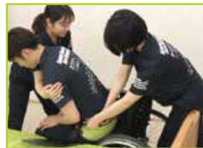
<介助者2名> 座奥へしっかり座れます。