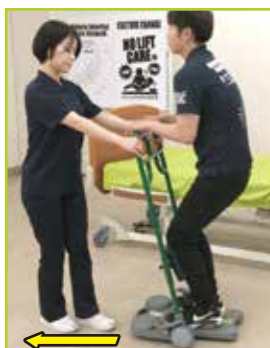
介助者は自分の方向にテイクオフを引きずります。