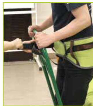
ストラップの長さを調整します。