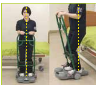
体の中心の位置を確認します。