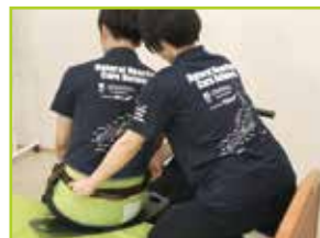
被介助者の背面からサポートします。