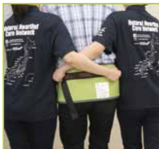
<介助者2名> 介助者の腕を交差させて、安定感を増したサポートができます。