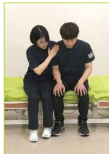
被介助者の動作状態の確認を行います。