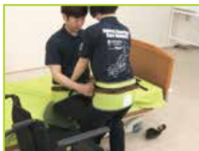
お互いがストラップをつかめるので、姿勢が安定します。